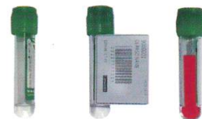
プリラベル検知機能 プリラベルを検知しその真上にバーコードラベルを 重ね貼りします。目視窓を隠すことなくラベルを 貼ることで検体量を確認しながら採血ができます。