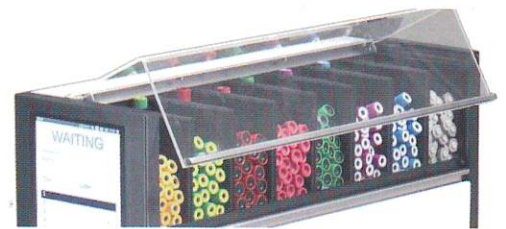
採血管収納数 8種類で最大200本の採血管がストックできます