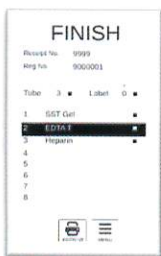
操作パネル 前面に10インチの大型タッチパネルを 装備し、採血管や患者様情報を表示します。 またタッチボタン操作により採血管の発行 指示、採血管の選択再発行操作が出来ます。