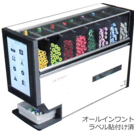
オールインワントレイ ラベル貼付け済み採血管、手貼りラベル 採血指示書がワントレイに排出されます